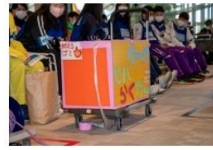
運搬に特化したアイテム例